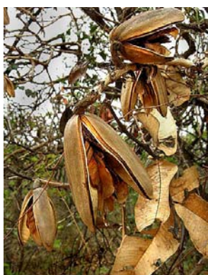
12 Qualea grandiflora