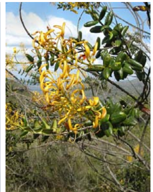
35 Vochysia rotundifolia