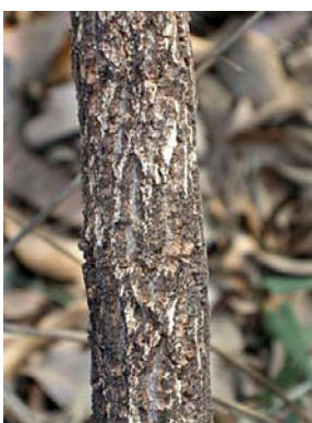
15 Qualea parviflora