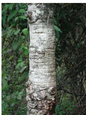
13 Qualea multiflora