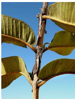
9 Qualea grandiflora