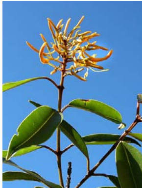
27 Vochysia acuminata