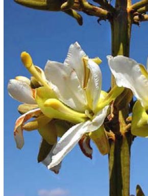
23 Salvertia convallariodora