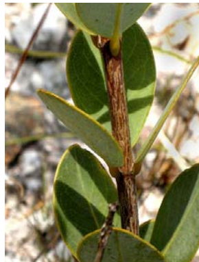
33 Vochysia pygmaea