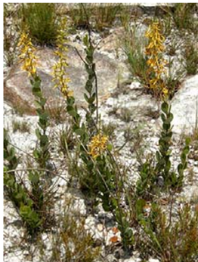
32 Vochysia pygmaea