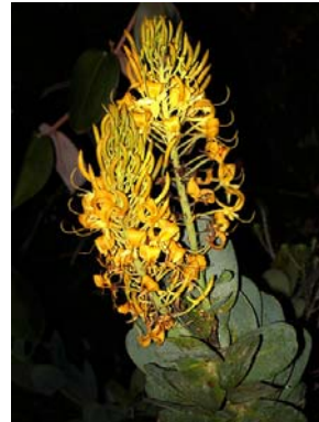
29 Vochysia elliptica