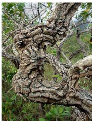
8 Qualea grandiflora