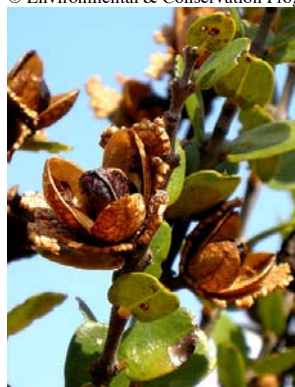
1 Callisthene major

©Gustavo H. Shimizu [ gustavoshimizu@gmail.com ] e Kikyo Yamamoto, Instituto de Biologia, Universidade Estadual de Campinas (UNICAMP), Campinas SP, Brasil © Environmental & Conservation Programs, The Field Museum, Chicago, IL 60605 USA [ rrc@fieldmuseum.org ] | www.fmmh.org/plantguides/ | Rapid Color Guide # 269 versão 1 06/2010