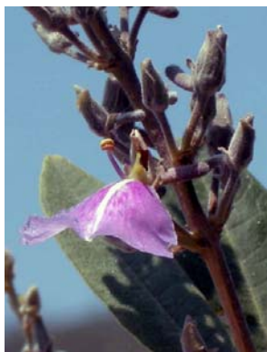
17 Qualea parviflora