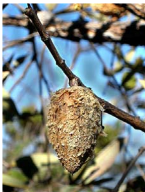
18 Qualea parviflora