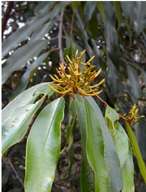
26 Vochysia acuminata