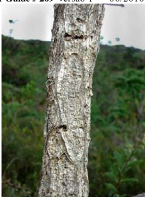
5 Qualea cordata