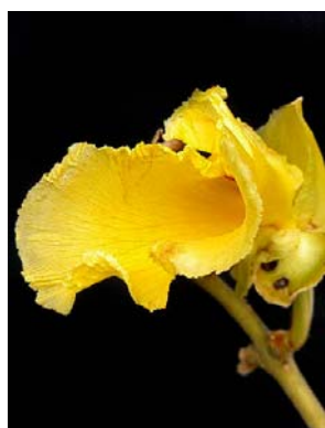
11 Qualea grandiflora