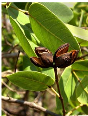
7 Qualea cordata