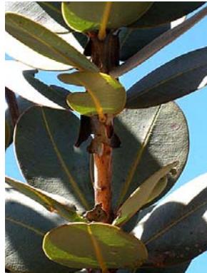
28 Vochysia elliptica