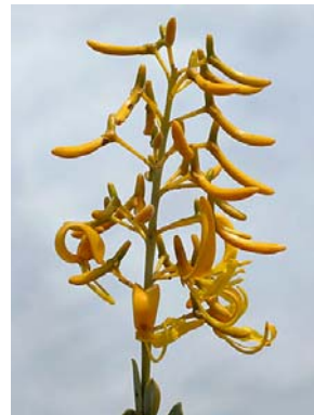
34 Vochysia pygmaea