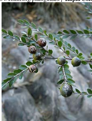
4 Callisthene microphylla