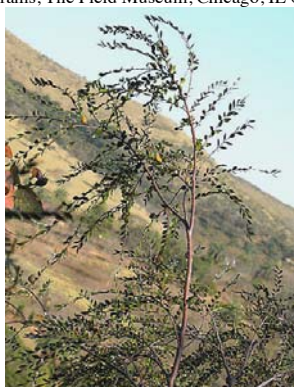
2 Callisthene microphylla