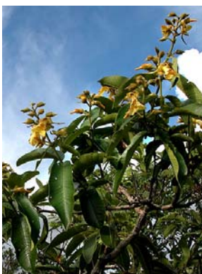
10 Qualea grandiflora