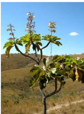
20 Salvertia convallariodora