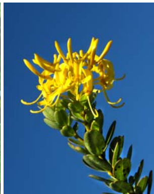
40 Vochysia sp. nov.