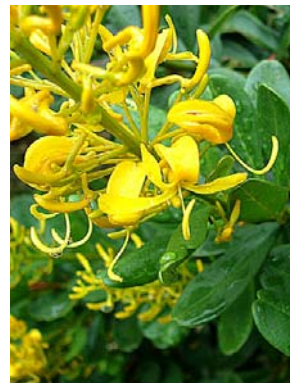
39 Vochysia tucanorum