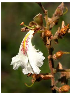
14 Qualea multiflora