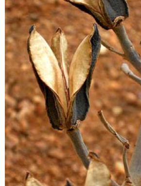
24 Salvertia convallariodora