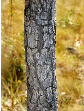
21 Salvertia convallariodora

©Gustavo H. Shimizu [gustavoshimizu@gmail.com] e Kikyo Yamamoto, Instituto de Biologia, Universidade Estadual de Campinas (UNICAMP), Campinas SP, Brasil © Environmental & Conservation Programs, The Field Museum, Chicago, IL 60605 USA [rrc@fieldmuseum.org] [www.fmnh.org/plantguides/] Rapid Color Guide # 269 versão 1 06/2010