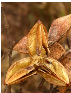
19 Qualea parviflora