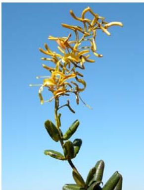
36 Vochysia rotundifolia