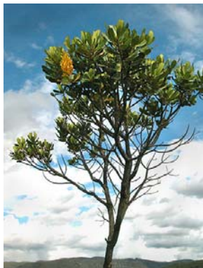
37 Vochysia thyrsoidea