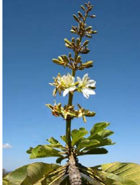
22 Salvertia convallariodora