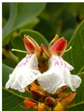
6 Qualea cordata