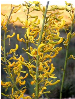
31 Vochysia emarginata