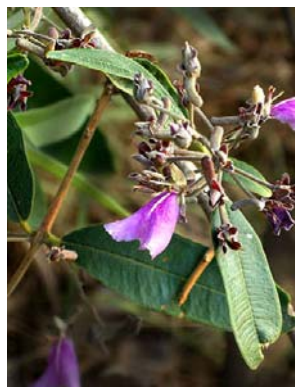
16 Qualea parviflora