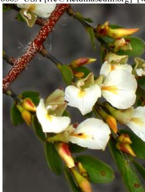
3 Callisthene microphylla