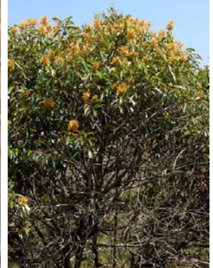
25 Vochysia acuminata