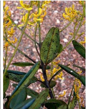
30 Vochysia emarginata