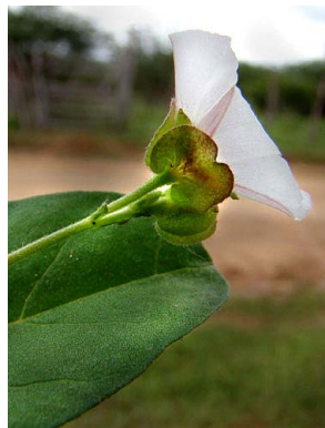
38 Jacquemontia gracillima