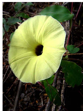
19 Ipomoea longiramosa