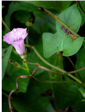
32 Ipomoea triloba