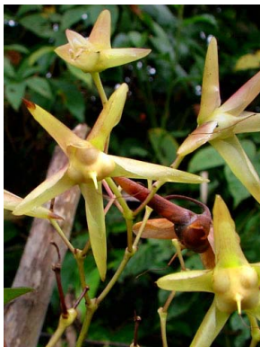
57 Merremia macrocalyx