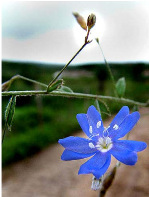
6 Evolvulus elegans