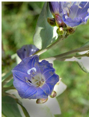
36 Jacquemontia glaucescens