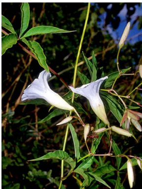
56 Merremia macrocalyx