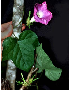
22 Ipomoea nil