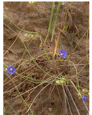
40 Jacquemontia linoides