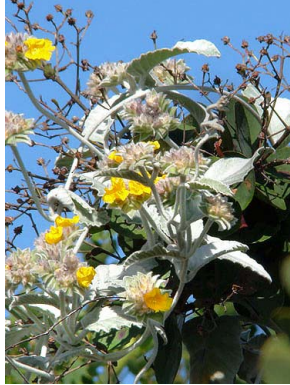
43 Jacquemontia montana