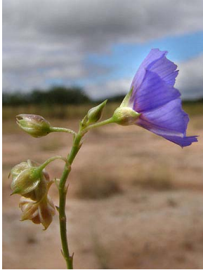
41 Jacquemontia linoides

[rrc@fieldmuseum.org] [www.fmn.org/plantguides] Rapid Color Guide #293 version 1 04/2011