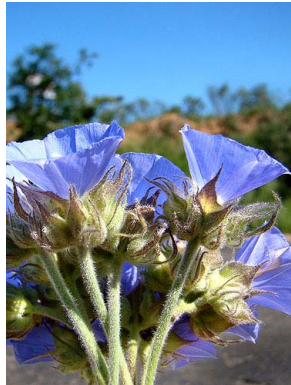
49 Jacquemontia pentantha