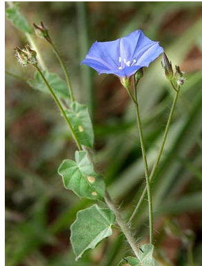
33 Jacquemontia agrestis