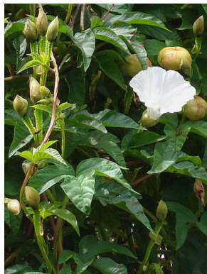
59 Operculina alata