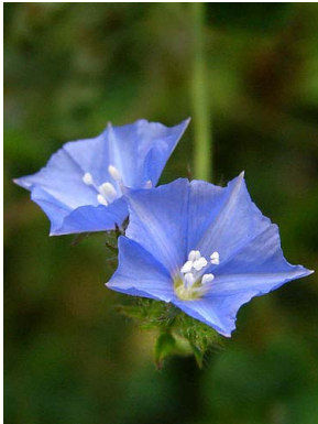
51 Jacquemontia sphaerostigma