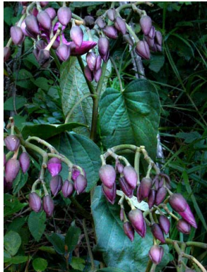
26 Ipomoea phillomega