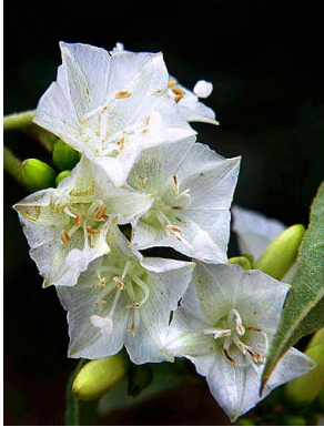
1 Bonamia burchellii

© Environmental & Conservation Programs, The Field Museum, Chicago, IL 60605 USA. [rcc@fieldmuseum.org] [www.fmn.org/plantguides] Rapid Color Guide #293 version 1 04/2011