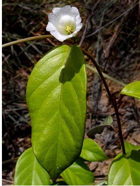
2 Bonamia maripoides