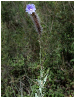
11 Evolvulus pterocaulon