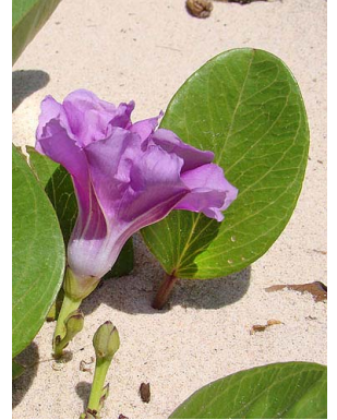
25 Ipomoea pes-caprae