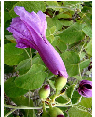
15 Ipomoea brasiliana