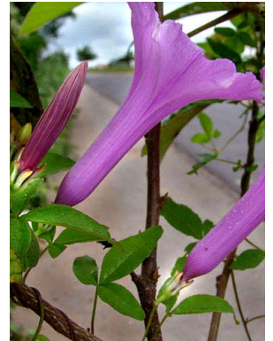
30 Ipomoea rosea