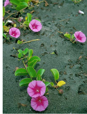
24 Ipomoea pes-caprae