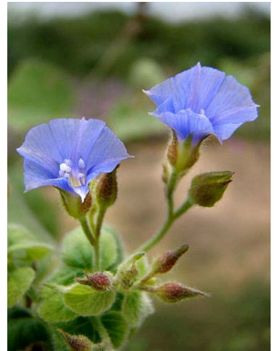
50 Jacquemontia racemosa