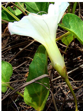
18 Ipomoea littoralis