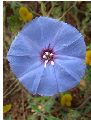
34 Jacquemontia agrestis