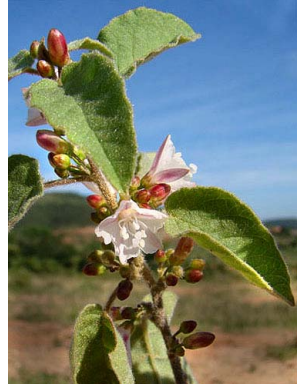
45 Jacquemontia nodiflora