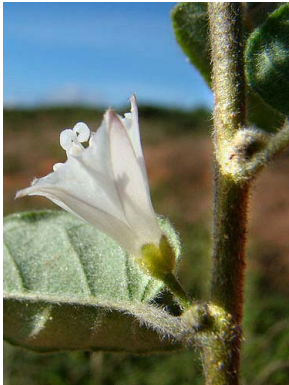
46 Jacquemontia nodiflora