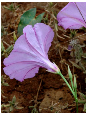
16 Ipomoea incarnata