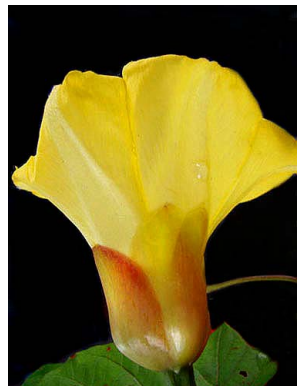
60 Operculina macrocarpa