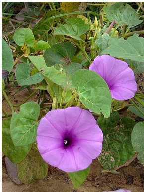
12 Ipomoea asarifolia