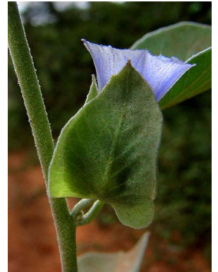
35 Jacquemontia estrellensis