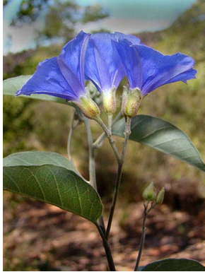
42 Jacquemontia martii