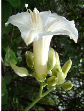
21 Ipomoea marcellia

© Environmental & Conservation Programs, The Field Museum, Chicago, IL 60605 USA. [rrc@fieldmuseum.org] [www.fmn.org/plantguides] Rapid Color Guide #293 version 1 04/2011