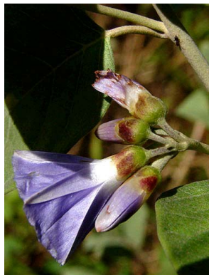
37 Jacquemontia glaucescens