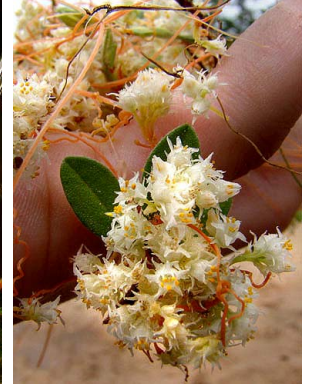
5 Cuscuta partita