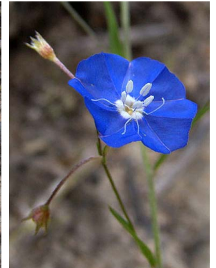
10 Evolvulus linarioides