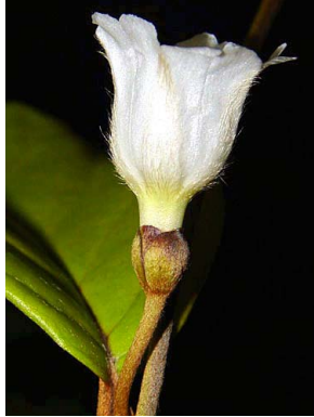
3 Bonamia maripoides