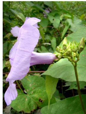
14 Ipomoea bahiensis