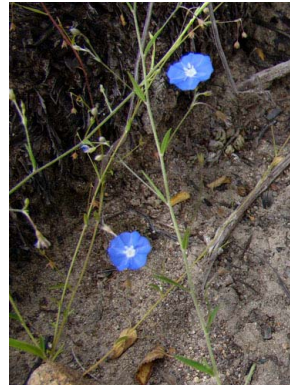
9 Evolvulus linarioides