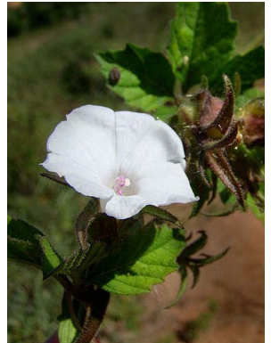
55 Merremia cissoides