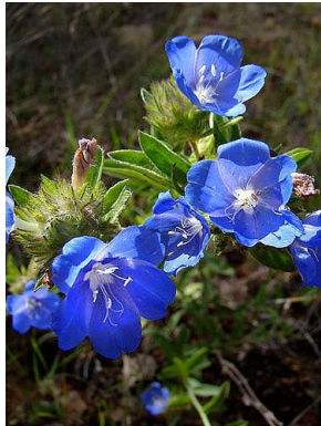
8 Evolvulus glomeratus