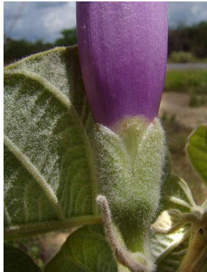
31 Ipomoea subincana