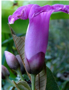
27 Ipomoea phillomega