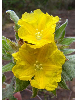
44 Jacquemontia montana