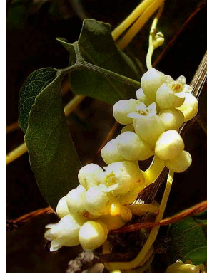
4 Cuscuta globosa