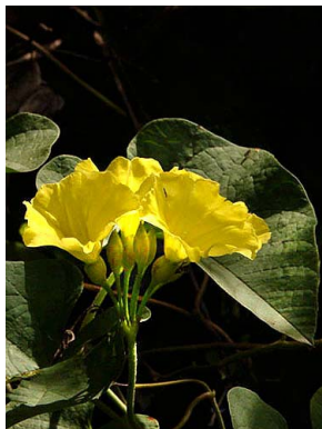
58 Merremia umbellata