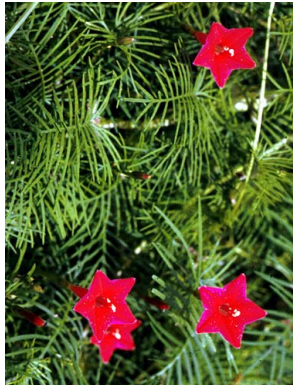
28 Ipomoea quamoclit