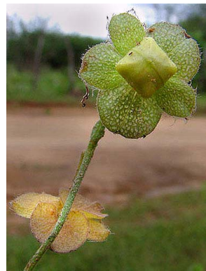
39 Jacquemontia gracillima