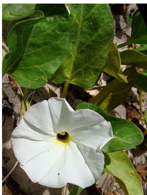
17 Ipomoea littoralis