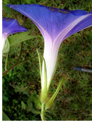
23 Ipomoea nil