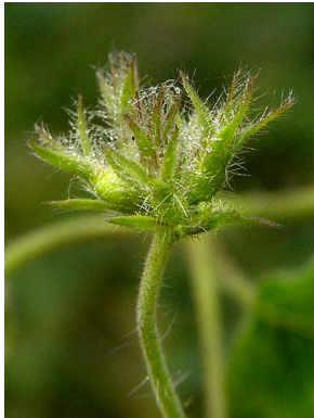
52 Jacquemontia sphaerostigma