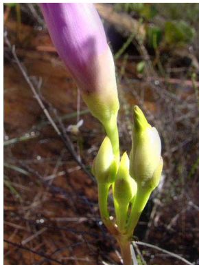
13 Ipomoea asarifolia