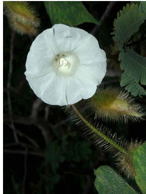
54 Merremia aegyptia