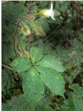
53 Merremia aegyptia