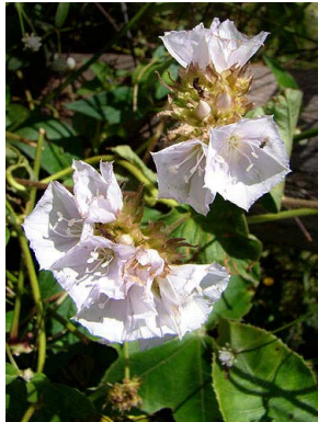
48 Jacquemontia pentantha