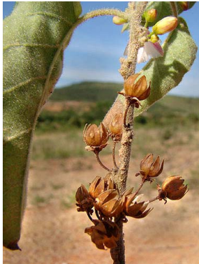
47 Jacquemontia nodiflora