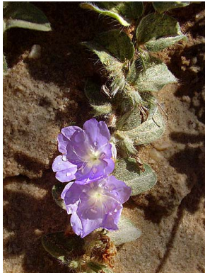
7 Evolvulus frankenioides