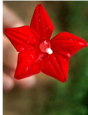
29 Ipomoea quamoclit