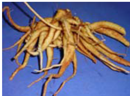
FIGURA 1. A). Plântulas da fáfia; B). Plantas de fáfia em fase desenvolvimento; C). Planta de fáfia em fase de florescimento;. D). Raízes de fáfia