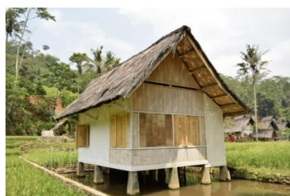
Casa de madeira e palha