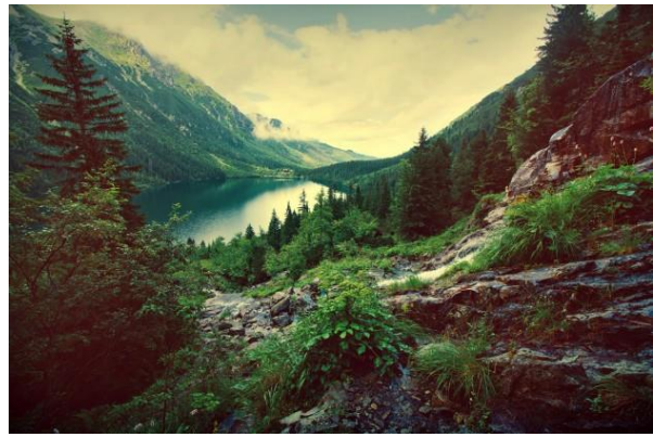
Figura 2: paisagem natural

Você gostaria de morar em qual desses lugares? Por quê?