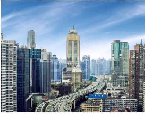
Figura 1: paisagem modificada

1) As fotos abaixo mostram duas paisagens: uma modificada pelo homem e outra natural.