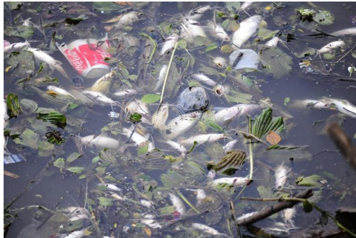
Peixes morrem devido à poluição humana

Assim, muitas espécies animais estão desaparecendo do Planeta.