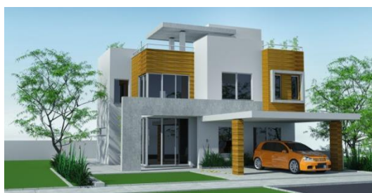
Casa moderna com materiais pré-fabricados

Atualmente, muitas casas são modernas e com materiais pré-fabricados, mas muitas ainda são feitas de elementos encontrados na natureza.